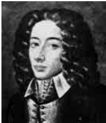
Giovanni Battista Pergolesi