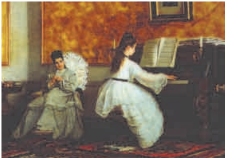
«Al pianoforte», un dipinto di Vito D'Ancona del 1873