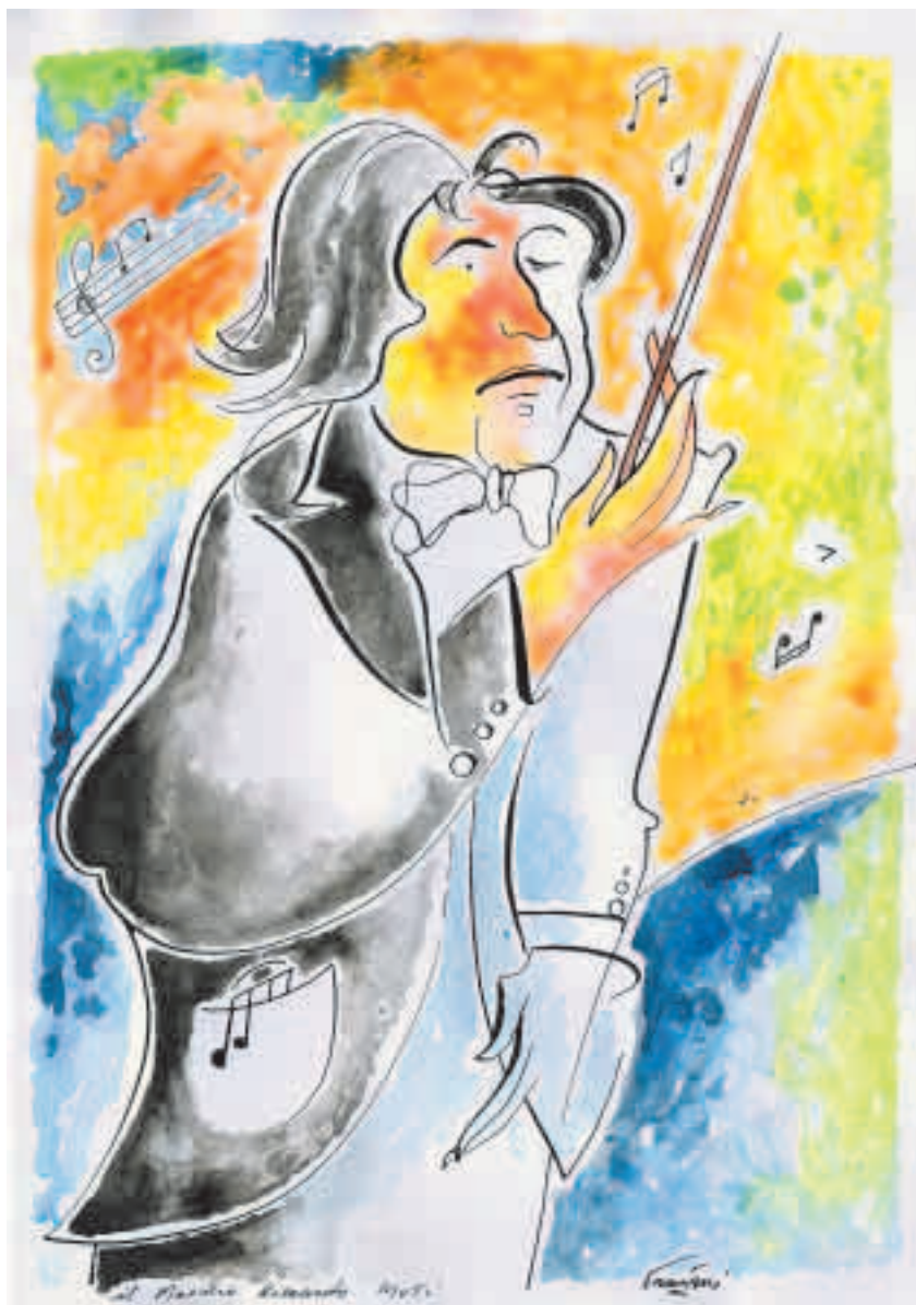
Un sorriso beneaugurante per il Maestro, un acquerello di Michele Damiani

Con un abbraccio grande dal Suo Michele Damiani