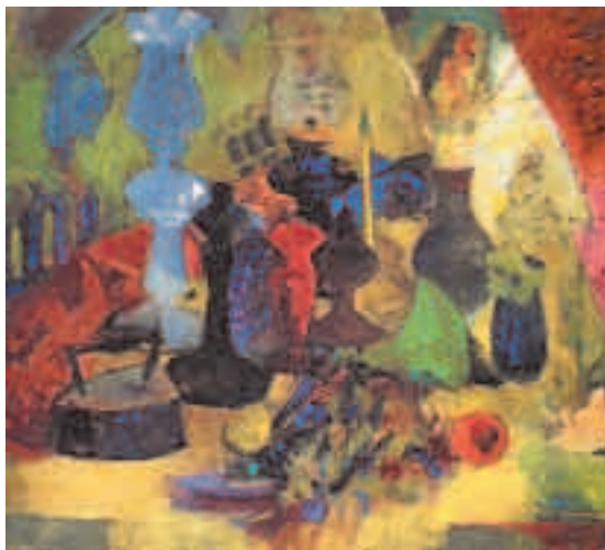
Roberto De Robertis, «Lumi e fiori secchi» (1960)